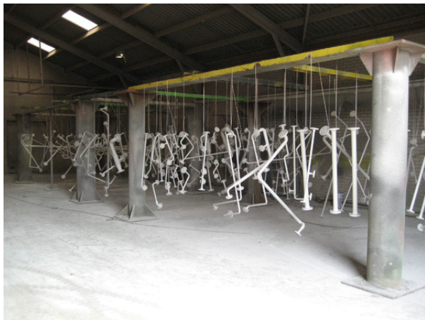
(piping vooraf conserveren te Markelo)