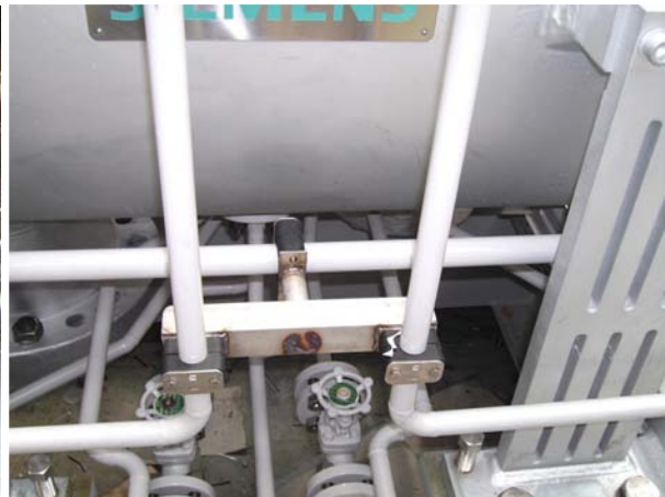
(te behandelen montageschades)