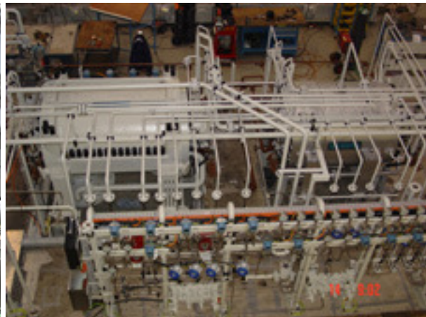
(overzicht complete compressorunit)