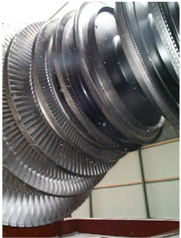
(overzicht één van de turbinerotoren gereed)