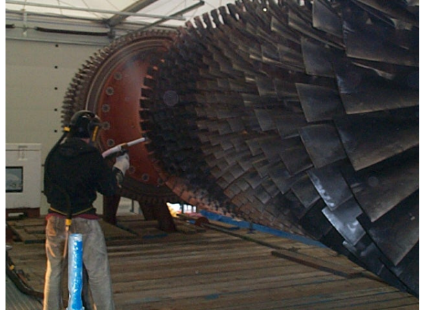
(overzicht tijdens het CO2 ijsstralen)