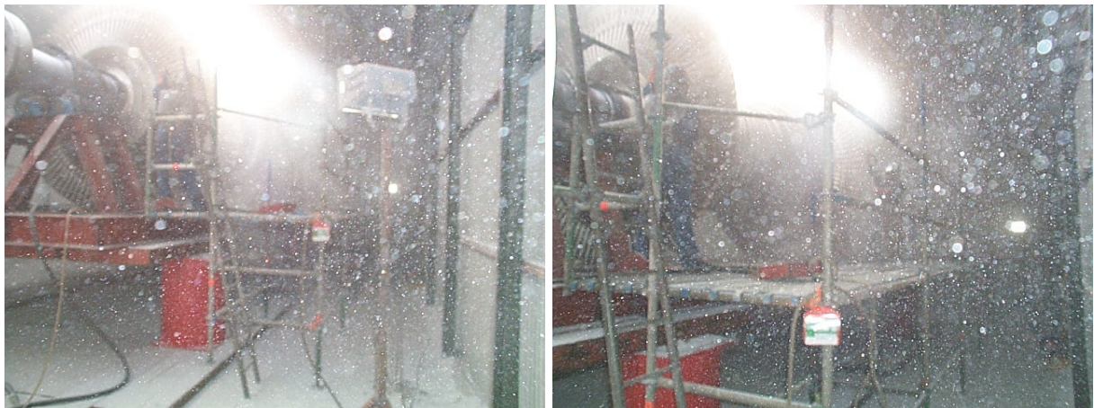
(overzicht tijdens het glasparelstralen)